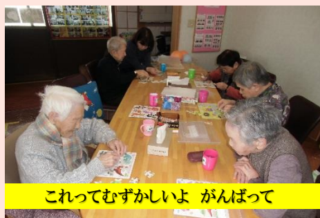
これってむずかしいよ がんばって