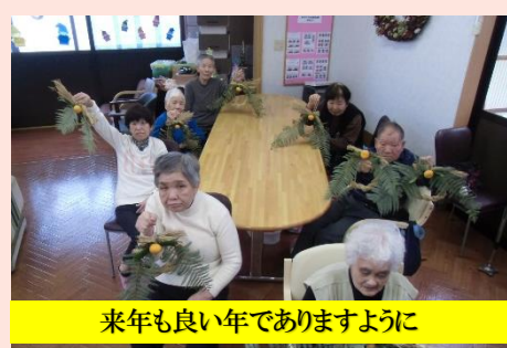
来年も良い年でありますように