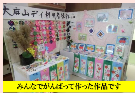
みんなががんばって作った作品です