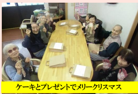
ケーキとプレゼントでメリークリスマス