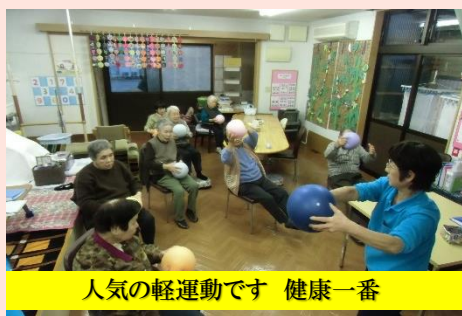
人気の軽運動です 健康一番