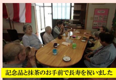
記念品と抹茶のお手前で長寿を祝いました