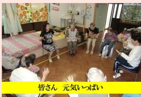
皆さん 元気いっぱい