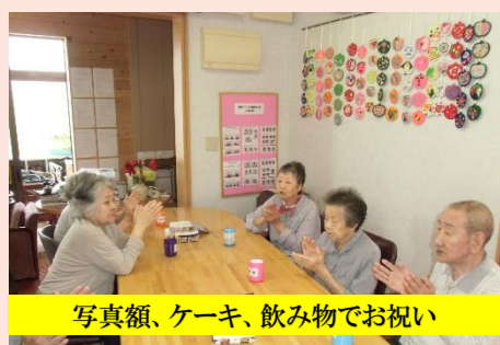
写真額、ケーキ、飲み物でお祝い